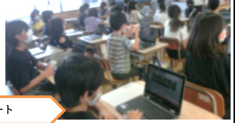
タブレットを活用した授業 順調にスタート