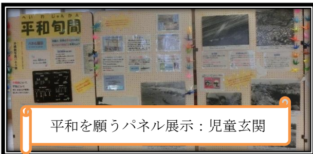
平和を願うパネル展示：児童玄関

嘉数小学校では、「慰霊の日」前後に、二度と戦争が起きることがないように、戦争の悲惨さを学び、平和を尊び、「命どう宝」の思いを育てる期間として、平和教育を実施しています。