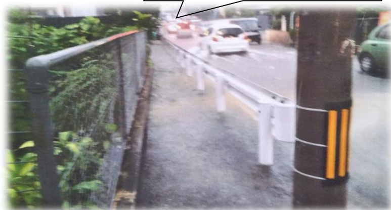
比屋良川公園前陸橋から 嘉数小学校向け道路

上・右画像は、6月26日(水)の午前8時過ぎの様子です。大雨で道路が浸水し、登校際、車道歩くなど危険な行為がみられました。