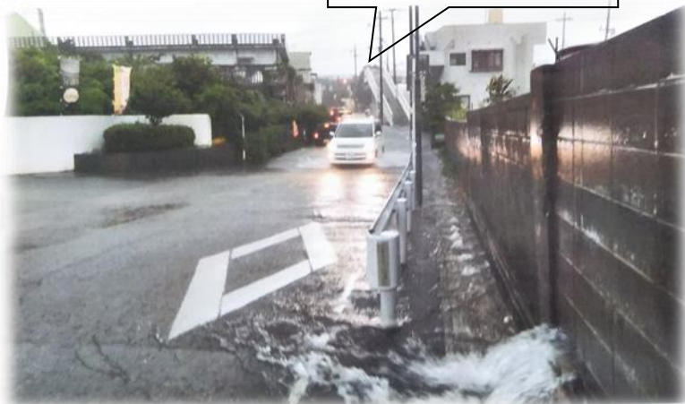
比屋良川公園前陸橋