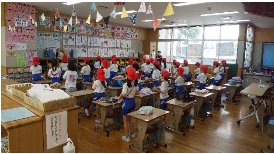
1年生 教室にて運動会ダンス練習