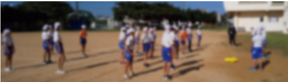
ペアタグ取りの様子