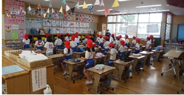
1年生 読書感想画取り組みの様子