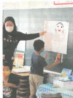
紙を繋ぐって、こういうこと?

「足が入らないよ」と気付いた子がいました。子ども達に「そうだね。どうしよう」と相談すると、「こうやって、紙を繋げばいいよ」とチョークで描いて説明する子が出てきました。賢いですね! 『つなぐ』という言葉も学びましたよ。「じゃあ、横が足りないときは、こうして…」とやってみせると、次々アイデアが飛び出します