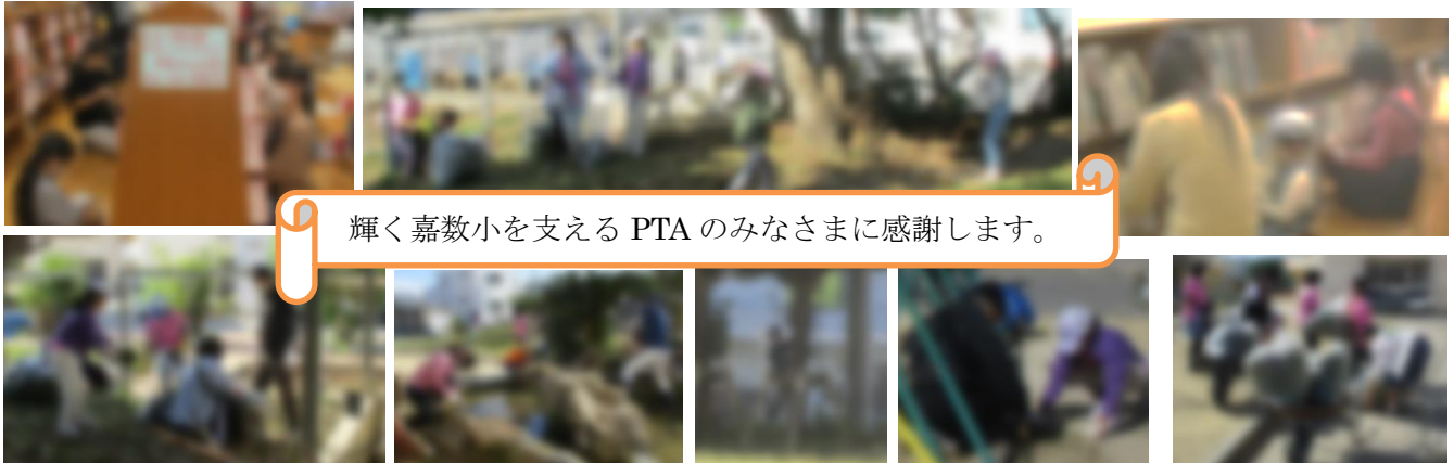
輝く嘉数小を支えるPTAのみなさまに感謝します。

令和4年度のゴールが目前に迫ってきましたが、嘉数っ子が自分のめあて・目標を達成して進級・進学できるように、学校教育活動の充実に努めて参りますので、どうぞご家庭におかれましては、引き続き子ども達への応援・励ましをよろしくお願い致します。